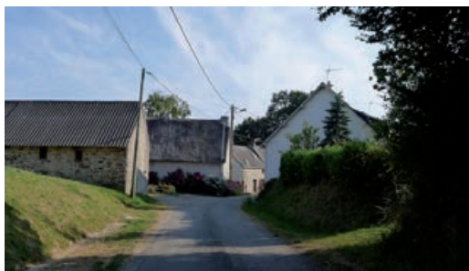
Pen Loc en venant de Mesquer