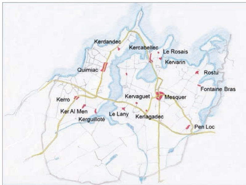
Les villages de Mesquer recensés par le Plan Local d'Urbanisme (carte T. Evette)

Connaissez-vous les aquarelles de Xavier Josso ? Elles nous montrent les paysages de Mesquer vers 1920 : salines, champs, haies basses, le regard porte loin... les hameaux, villages et moulins sont autant de repères dans la commune. Aujourd'hui, beaucoup d'entre eux se fondent dans la végétation ou les constructions qui les ont enserrés depuis un siècle.