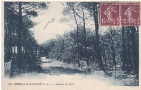
Le bois de Lanseria, vers 1920