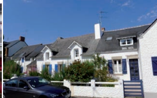
Quimiac, rue centrale 2013