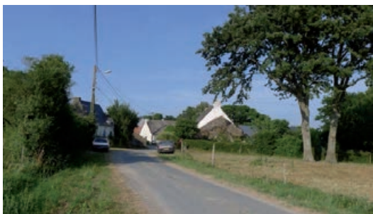
Pen Loc depuis les champs