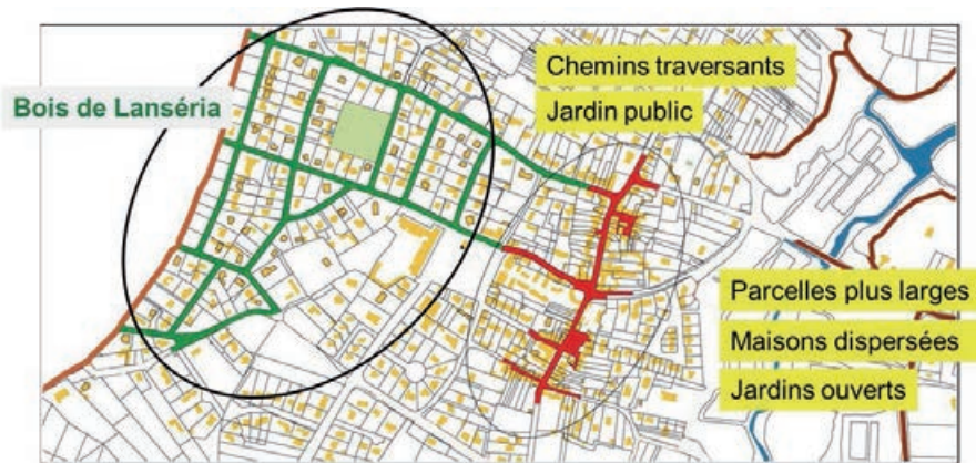
Bois de Lanséria : la station balnéaire des années 1920-1950