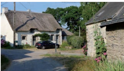
Pen Loc chaumière et fontaine