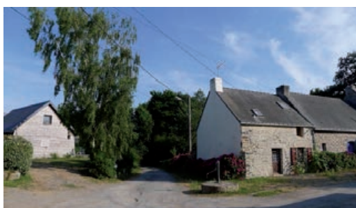
Pen Loc, à gauche la nouvelle maison

Préserver l'architecture des maisons anciennes, veiller à ce que les nouvelles n'en rompent pas l'harmonie, maintenir les transitions végétales qui marquent l'entrée du hameau... autant de moyens de respecter et faire connaître ce patrimoine si attirant.