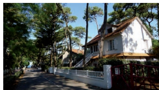
Le bois de Lanseria, 2013

L'actuel Plan local d'urbanisme ralentit l'expansion de la construction, mais la qualité des paysages reste à protéger, notamment des clôtures hautes qui transforment les rues en couloirs aveugles.